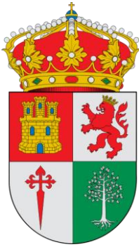
AYUNTAMIENTO DE ALMADÉN DE LA PLATA (SEVILLA)